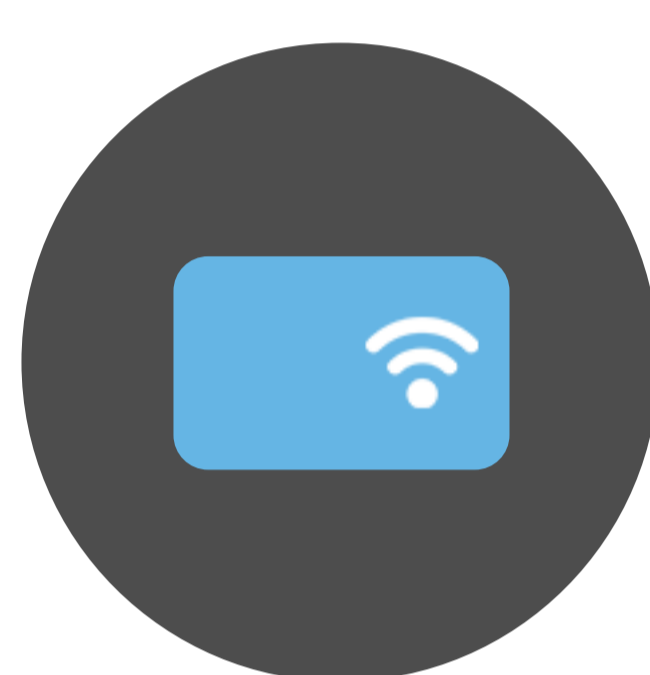
Cartão de Aproximação